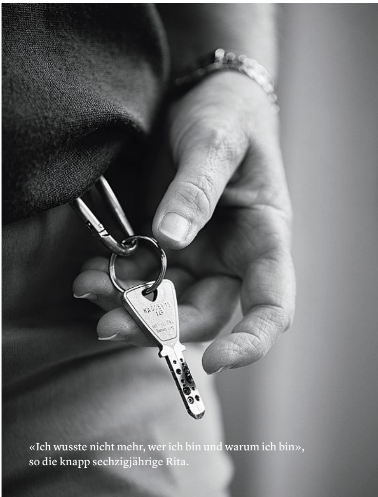
«Ich wusste nicht mehr, wer ich bin und warum ich bin», so die knapp sechzigjährige Rita.